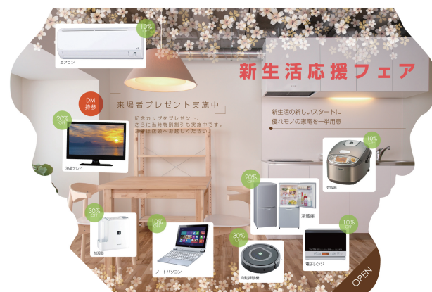
デザインサンプル (中面)