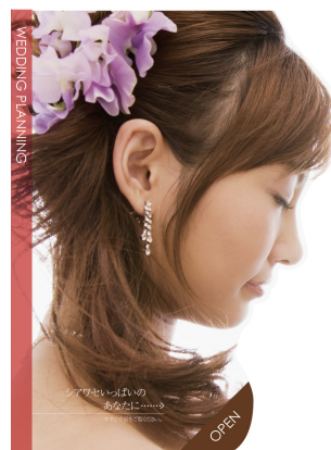
仕上がりイメージ