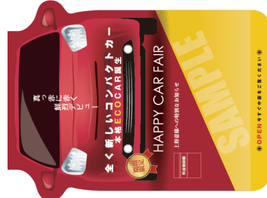
仕上がりイメージ