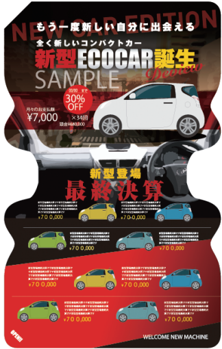
135_B_Design sample (中面)