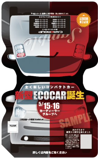
135_F_Design sample (表面)